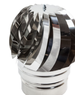
Terminale Eolico Tondo