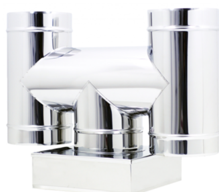
Terminale ad H Base Quadra