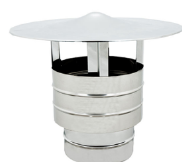
Terminale Antivento Tondo