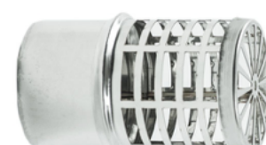
Terminale Eco Pellet